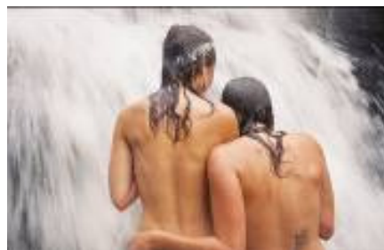
Fig 02. Lésbios 2

É ideal não confundir sensualidade com obscenidade. Segundo Jeudy, é obsceno o corpo que tornar-se o próprio espectador de sua manifestação e esgotar seu poder como referencial da própria representação. Não se duvida que a obscenidade reafirme a soberania da beleza, entretanto esse estágio só é atingido quando a obscenidade for autônoma e intransponível. No auge do prazer amoroso, é o corpo o principal sujeito (por que não objeto?) do jogo entre o idêntico e o diferente. Ou seja, “é o corpo ‘próprio’ que se torna expressão da obscenidade” (JEUDY, 2002, p. 127).